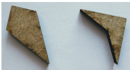
Figure 10. Deux formes, autres que le rectangle, ayant « deux traits grands et deux traits petits »