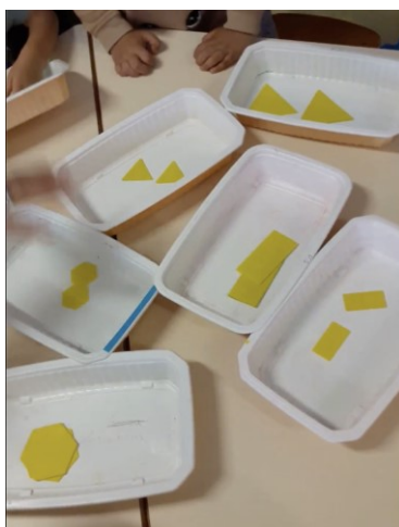
Figure 7. Quelques catégories proposées dans la classe de Nina (épisode 2)

Nina attire ensuite l'attention des élèves sur les autres catégories créées (Figure 7).