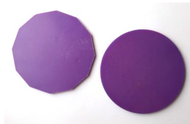
Figure 2. Un polygone et un disque

Comment alors aider l'élève à dépasser ces appréhensions spontanées ? Par la seule perception visuelle, toutes les propriétés d'une forme sont perçues simultanément : lors du traitement d'un problème de catégorisation, l'élève pourrait se contenter d'un traitement perceptif. Mais, lorsque les perceptions haptique 6 et visuelle sont associées, l'élève peut dépasser ses premières appréhensions pour commencer à appréhender les formes de manière plus analytique. Nous parlons alors d' appréhension séquentielle : l'élève qui regarde une forme et touche son contour conjugue les perceptions visuelle et haptique, il est ainsi amené à dépasser l'appréhension globale de la forme pour aller, par un traitement davantage analytique, vers une appréhension séquentielle.