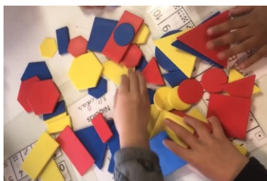
Figure 3. Les formes proposées dans la classe de Prisca (épisode 1)

Dans sa classe, Prisca propose à cinq de ses élèves (4-5 ans) un assortiment de formes usuelles en plastique incluant des disques, des triangles équilatéraux, des carrés, des rectangles, des hexagones réguliers ; ces formes sont bleues, rouges ou jaunes et, selon la nature, de deux tailles différentes 9 (Figure 3). Cinq barquettes sont aussi fournies, posées au centre de la table où les élèves sont en activité.