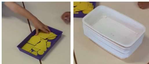
Figure 6. Les matériels proposés dans la classe de Nina (épisode 2)

Nina : je veux qu'ensemble vous trouviez un rangement regardez je vous donne plein de boîtes voyons ce que vous êtes capables de faire [elle s'éloigne]