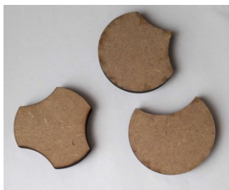
Figure 11. Des formes aux bords arrondis et « pointues »