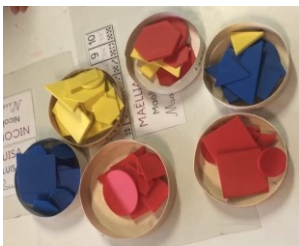
Figure 4. Premières catégories réalisées dans la classe de Prisca (épisode 1)

Un élève (Nicolas) pose un tas de formes rouges dans une boîte, différente de celle déjà remplie par des formes de cette couleur. Un élève (Thiebaud) pose des carrés bleus et jaunes dans une boîte vide mais aussitôt un autre élève (Maé) enlève les carrés bleus et ajoute d'autres formes jaunes. Le travail terminé, les catégories réalisées sont celles que l'on voit dans la Figure 4.