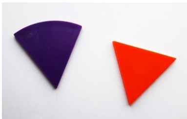
Figure 1. Un triangle et un secteur angulaire

affirme que le jeune apprenant reconnaît les formes à leur aspect global et les classe de manière exclusive les unes par rapport aux autres : « Un enfant reconnaît un rectangle à sa forme et un rectangle lui semble différent d'un carré » (Van Hiele, 1959, p. 201). Selon l'approche piagétienne, la représentation de l'espace se construit en passant par trois stades : pendant le premier stade dit de l'espace topologique, l'enfant ne distingue pas aisément les formes à bords rectilignes des formes à bords curvilignes (Piaget et Inhelder, 1947). Lors du traitement d'un problème de catégorisation de formes géométriques, par exemple, un élève pourrait associer un triangle et un secteur angulaire (Figure 1) 5 ou bien un polygone régulier ayant beaucoup de côtés avec un disque (Figure 2). Nous parlons ainsi d' appréhension topologique .