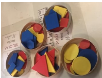
Figure 5. Nouvelles catégories réalisées dans la classe de Prisca (épisode 1)

Les élèves poursuivent la catégorisation et, lorsqu'il reste peu de formes sur la table, c'est Gabin qui se charge de terminer (Figure 5) en les déposant dans les barquettes correspondantes, sous la supervision de tous les autres.